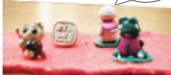
親子で作った人形。4～6g

粘土 210円 量り売り ¥15/g 店内で焼くことも出来ます。 1回 100円